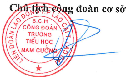
Chu Thị Vân

Biên bản được lập xong vào lúc 17 giờ 00 phút cùng ngày, đại diện các bên tham gia cùng thống nhất ký tên dưới đây.