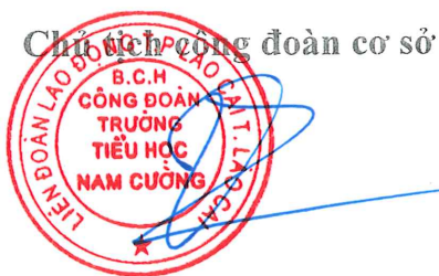
Chu Thị Vân

Biên bản được lập xong vào lúc 17 giờ 00 phút cùng ngày, đại diện các bên tham gia cùng thống nhất ký tên dưới đây.